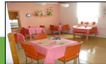
Jídelna odd. D2

Zajišťujeme klientům celodenní stravu připravovanou ve vlastním stravovacím provozu. Připravujeme běžnou stravu a také stravu dietní (žlučnickovou, diabetickou a diabetickou žlučnickovou). Na odděleních domova jsou k dispozici jídelny.