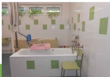
Koupelna pečovatelské služby

Pečovatelská služba je poskytována v pracovní dny v době od 6:30 do 18:00 hodin