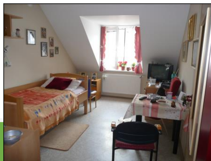
Jednolůžkový pokoj odd. A3

Areál DpS je rozdělen na dvě části. V zrekonstruované zástavbě má každý pokoj svoje sociální zařízení. Ve starší zástavbě jsou společné toalety, koupelna i sprcha vždy na patře. Rekonstrukce starší zástavby patří ke strategickým plánům domova tak, aby splňovala moderní požadavky klientů sociální služby. Obě budovy jsou vybaveny výtahy.