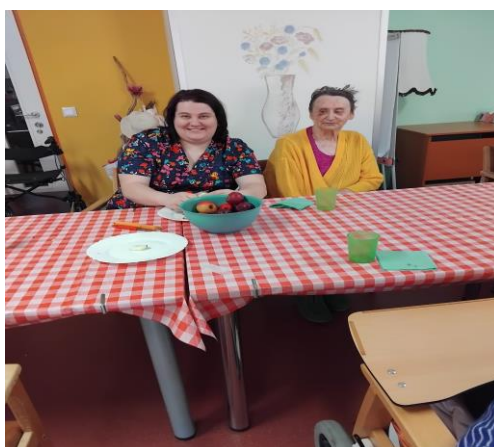
A ze zbylých jablíček jsme si udělali štrúdl ke kávičce.