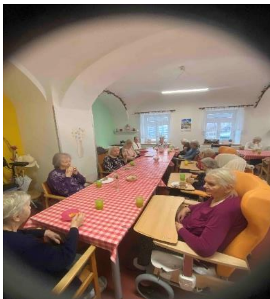
Loupání jablek na páteční žemlovku k večeři